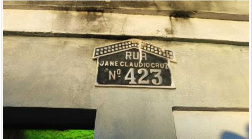
Identificação do imóvel