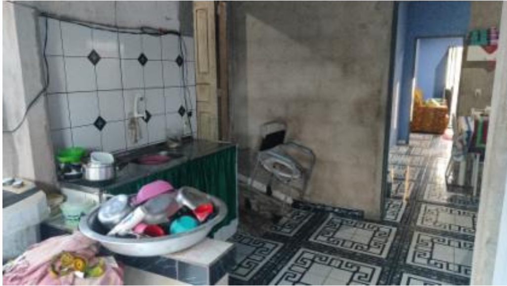
Lavanderia e cozinha