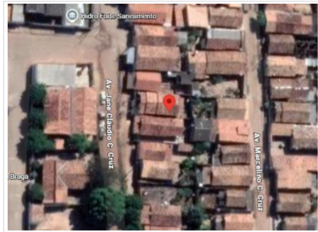
Croqui de localização do avaliando