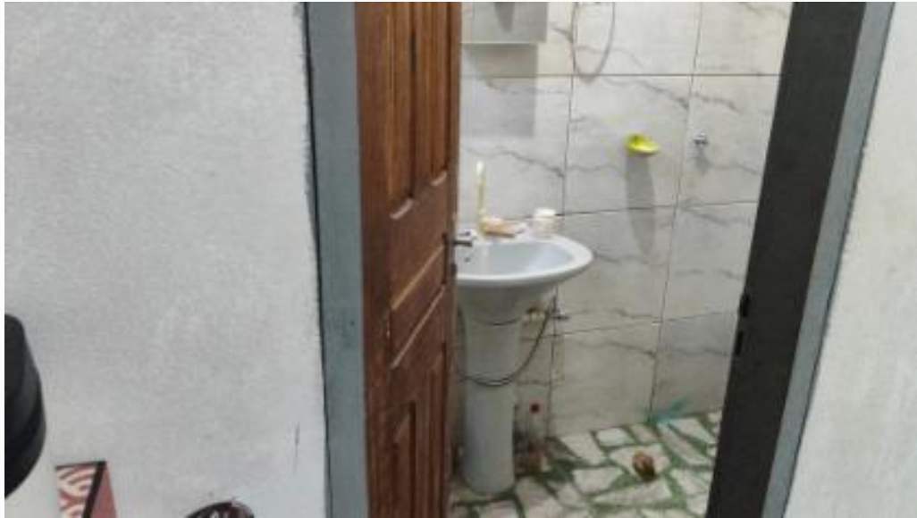
Banheiro da suíte