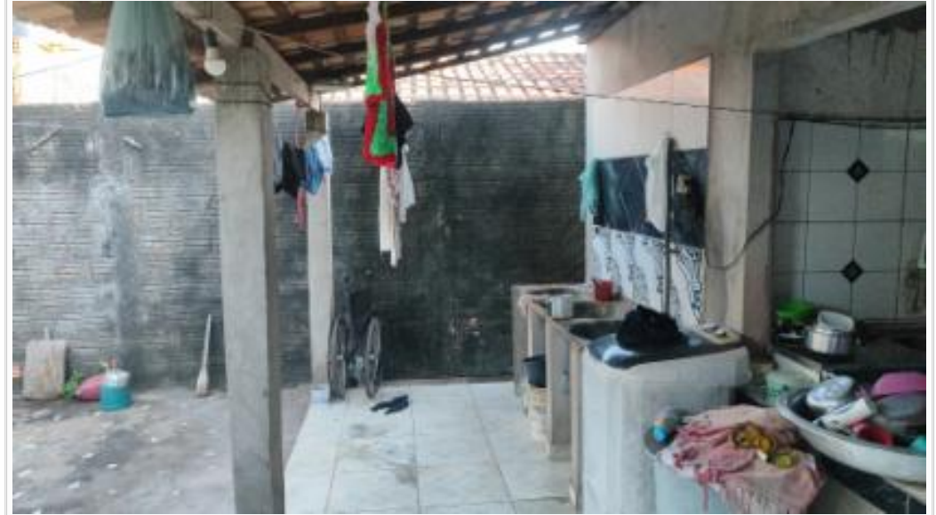
Lavanderia e cozinha