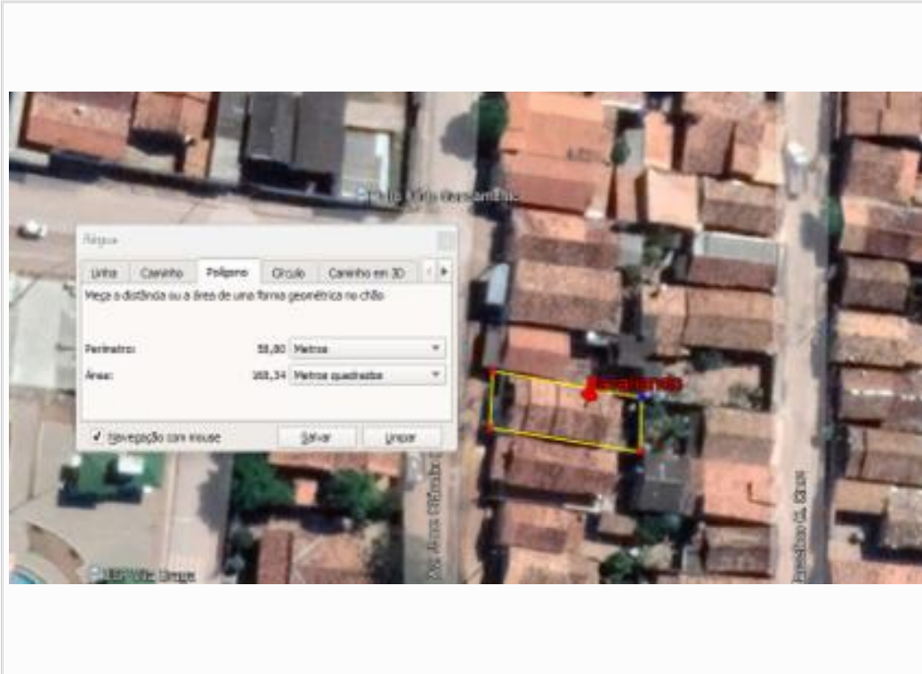
Croqui polígono do terreno