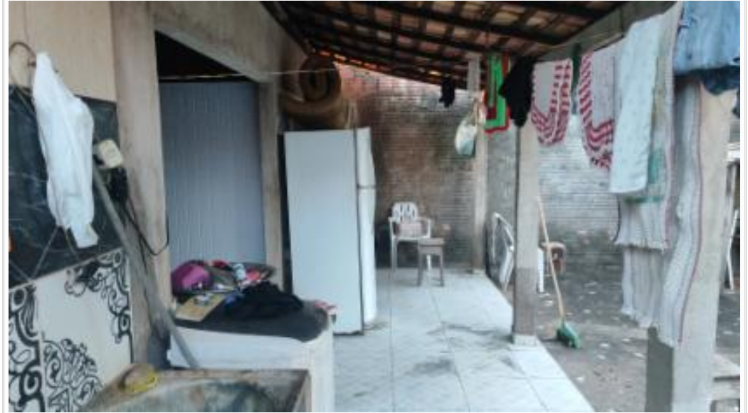
Cozinha e lavanderia