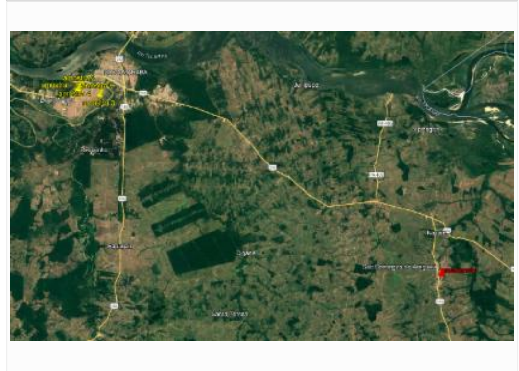
Croqui de localização das amostras