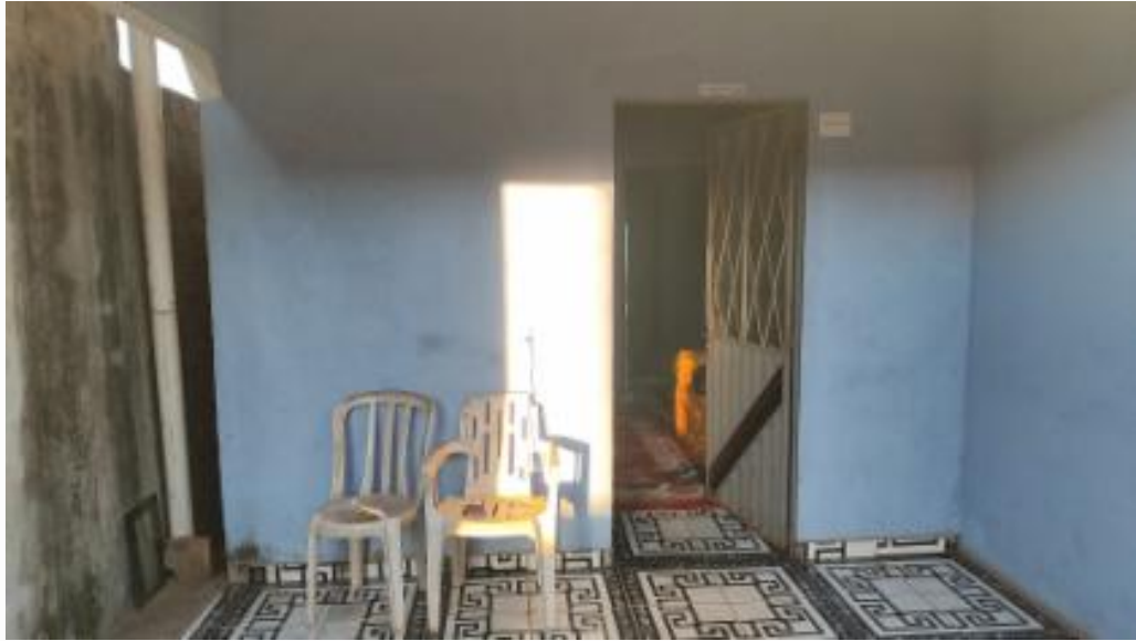
Varanda e garagem