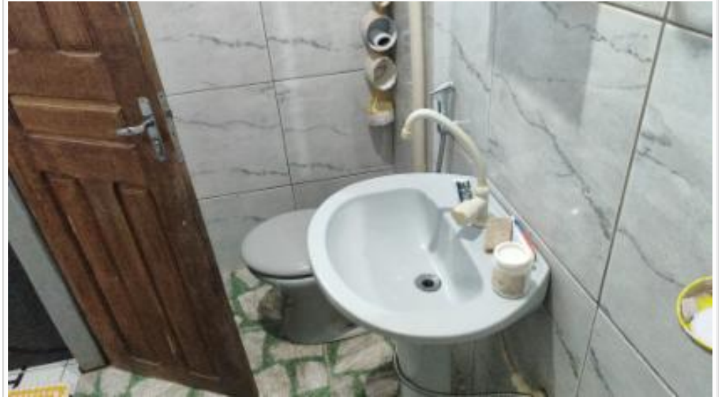
Banheiro da suíte