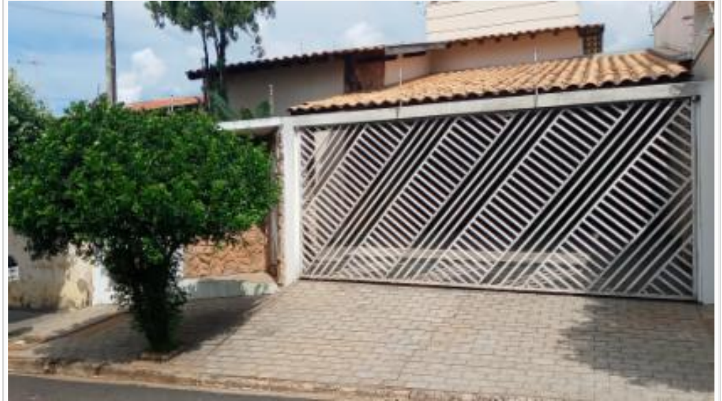
Vizinho frente sem nuemro