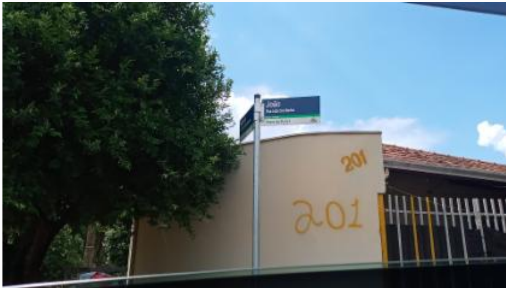
Placa da Rua