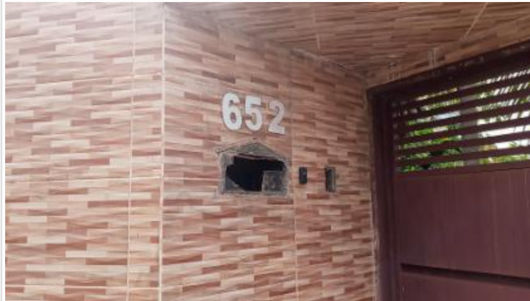
Numero vizinho esquerdo