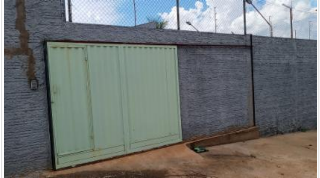
Vizinho direito sem numero