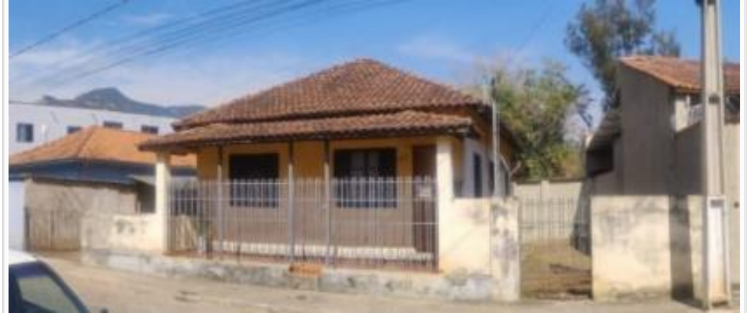
vista da fachada