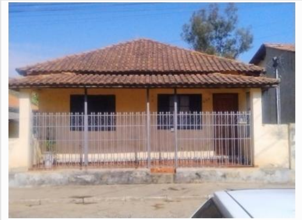
vista da fachada