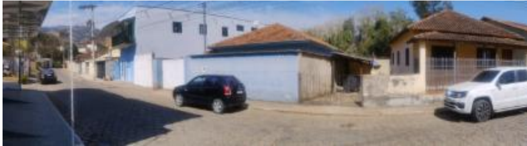
vista da rua