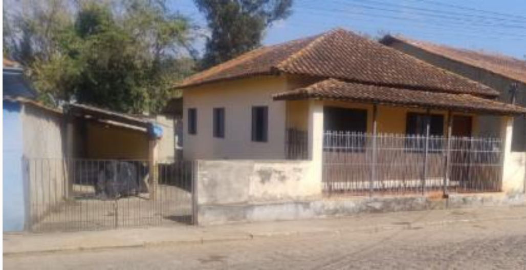
vista da fachada