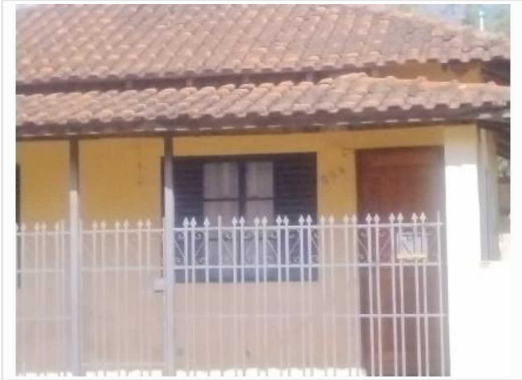
id do imóvel