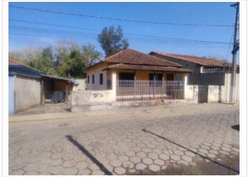
vista da fachada