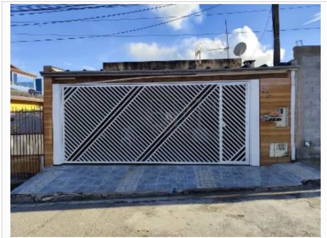
Fachada do imóvel avaliando