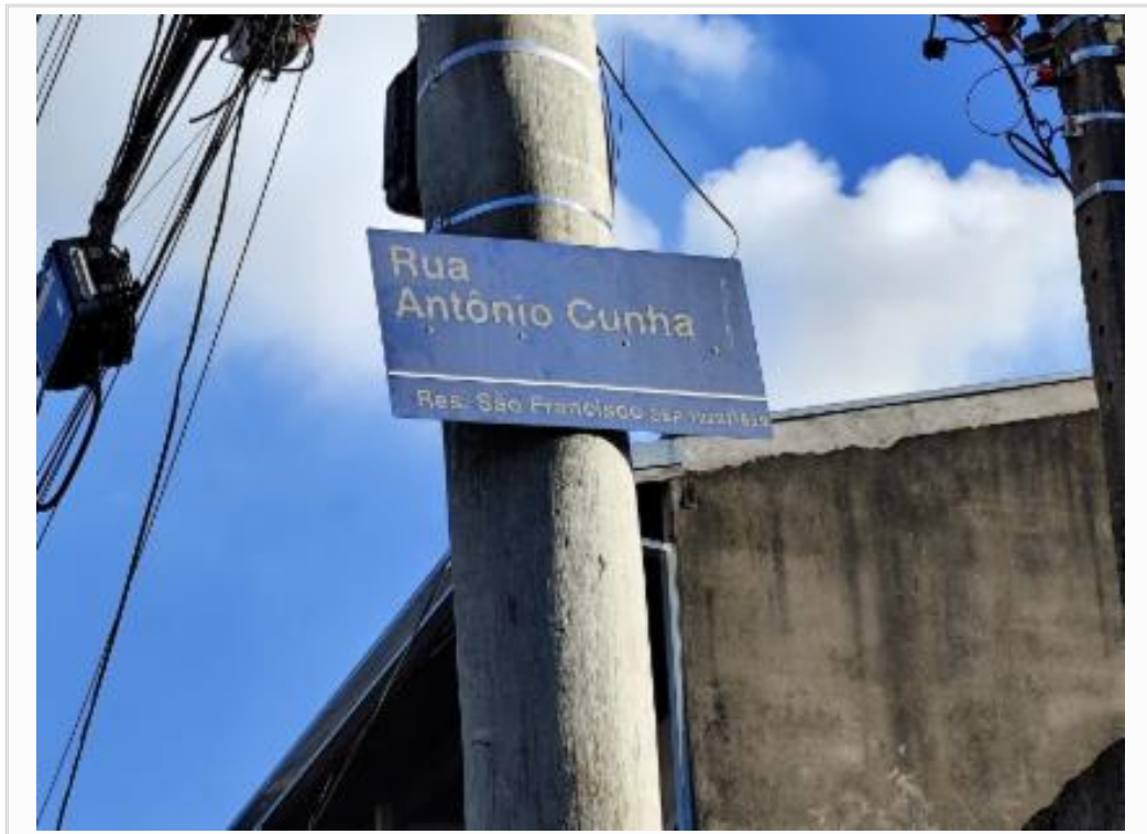
Placa de identificação da rua do imóvel.