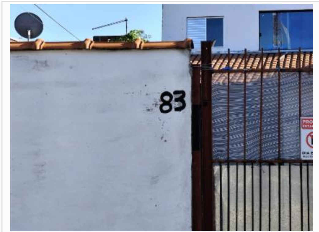
id vz esq.