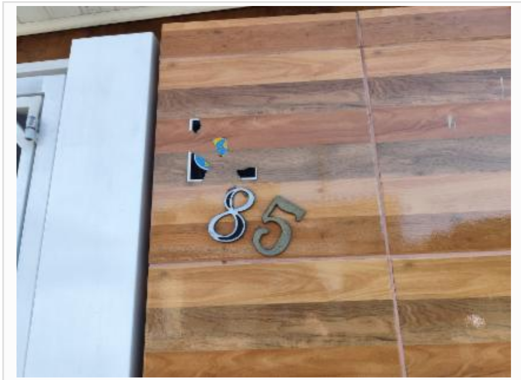
Número de identificação do imóvel