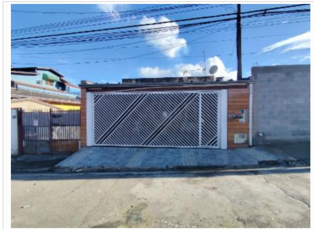
Fachada do imóvel avaliando