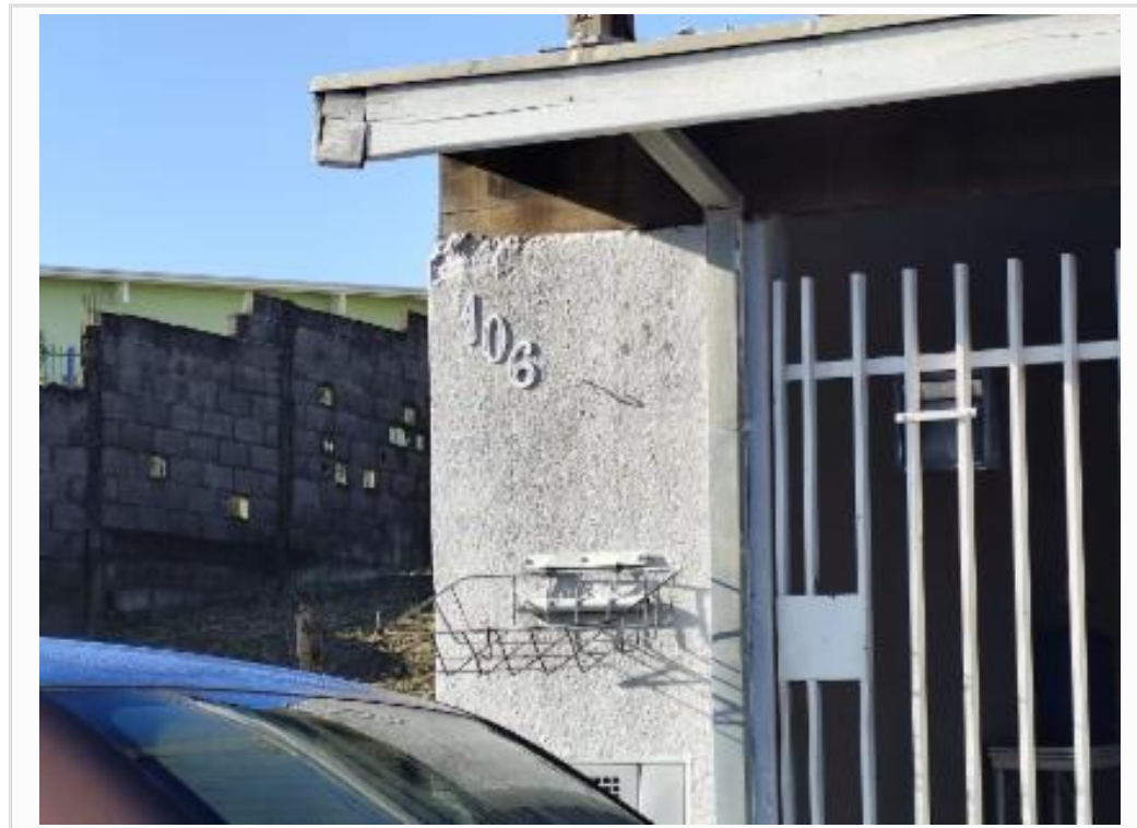
id Vizinho frontal