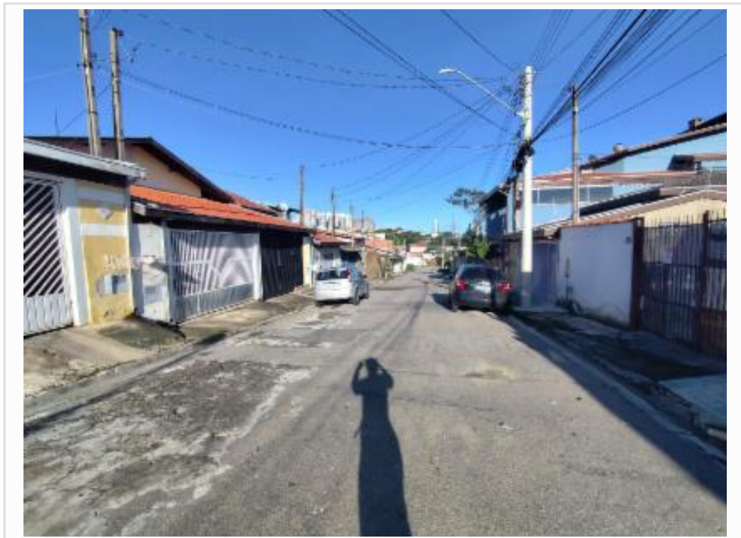
Vista da rua à direita