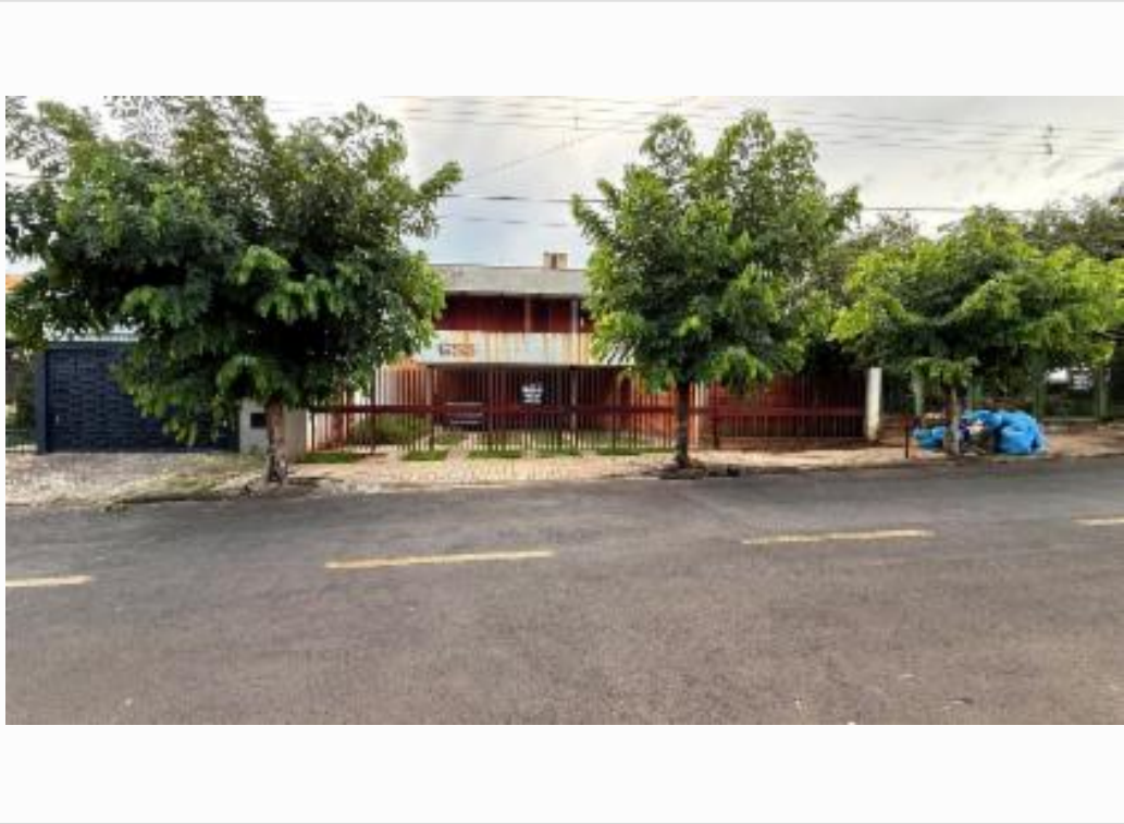
Fachada do vizinho direito