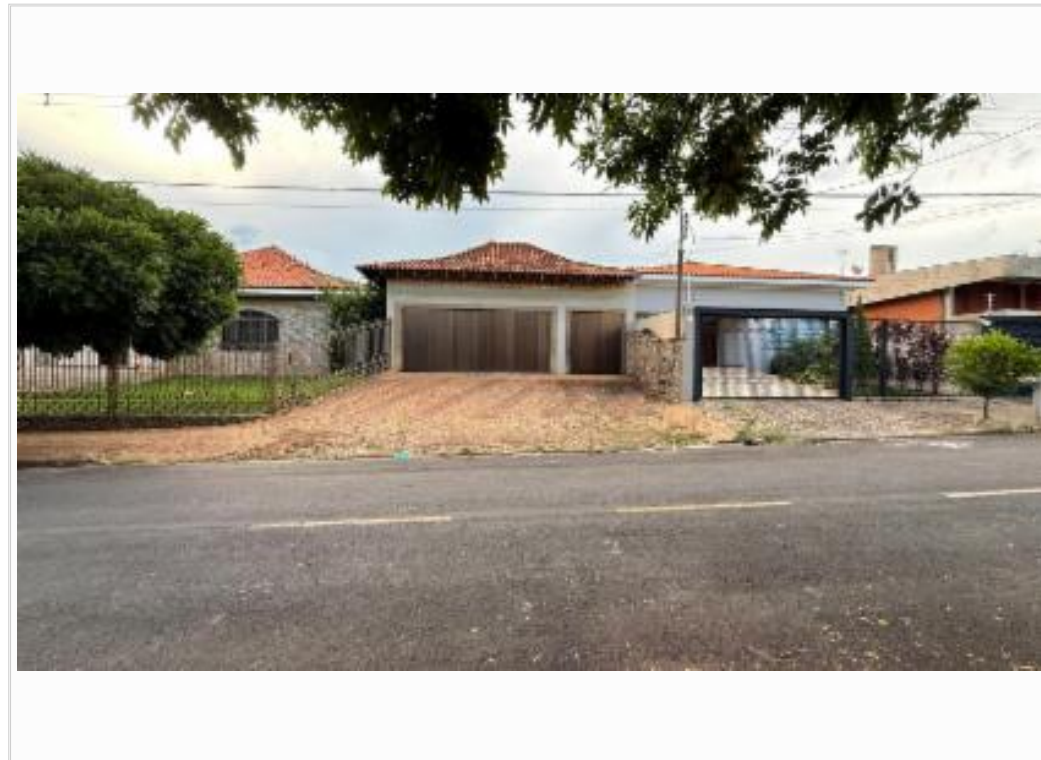
Fachada do vizinho esquerdo