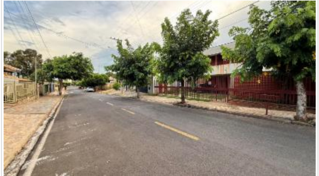
Vista da rua