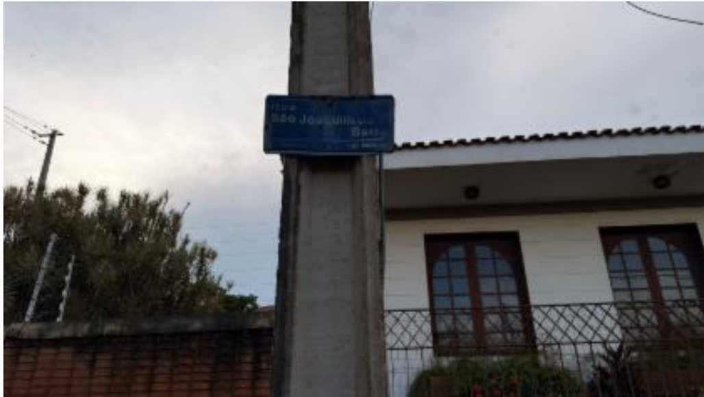
Placa de identificação da rua