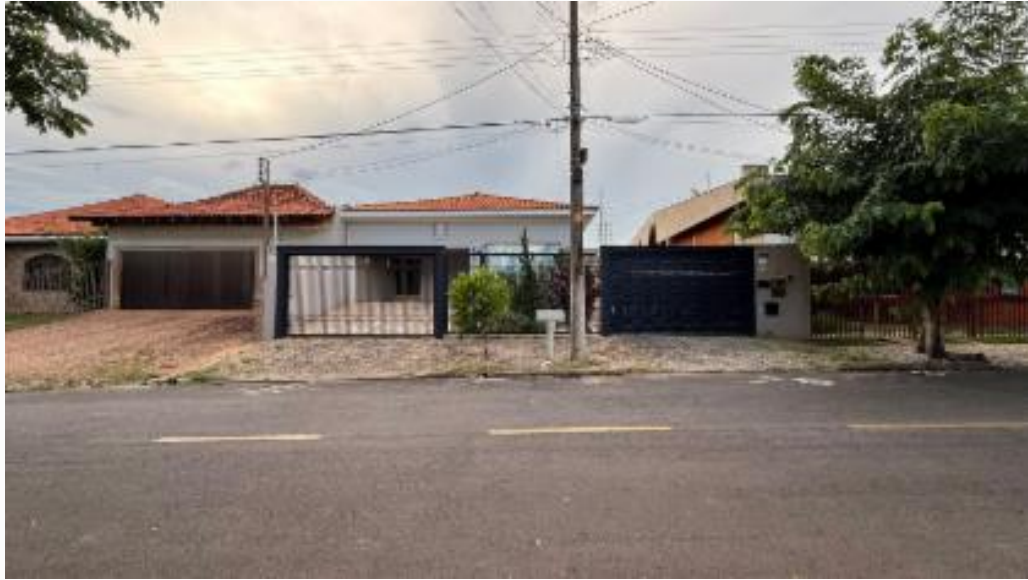
Fachada do imóvel