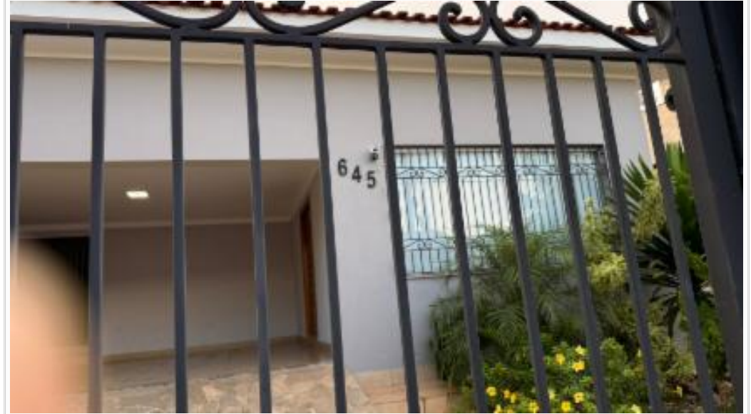
Número do imóvel