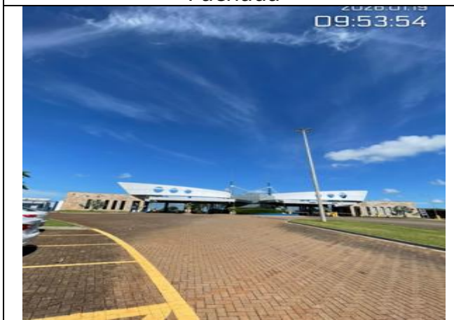
Via de Acesso