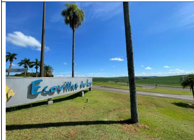
Identificação do Condomínio