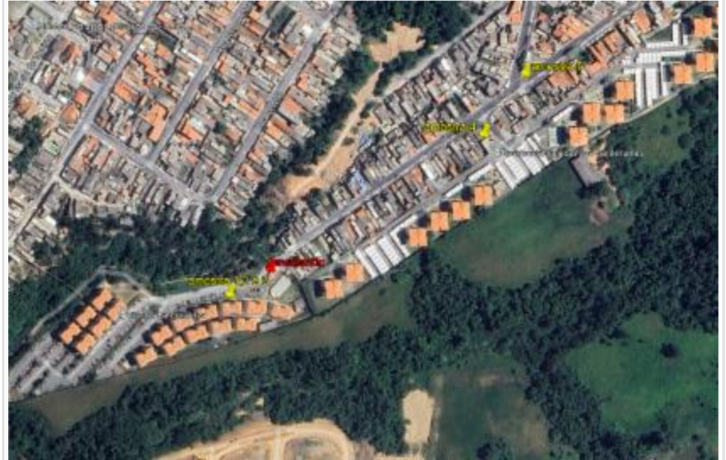
Croqui de localização das amostras