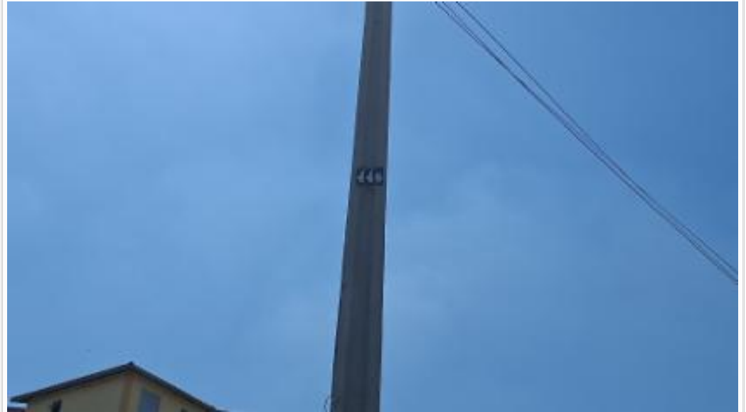
Numeração vizinho esquerdo