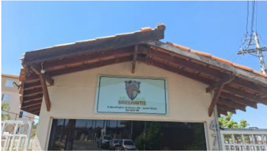
identificação numérica condomínio