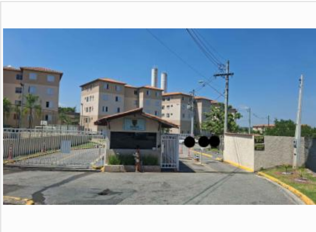
Fachada do condomínio