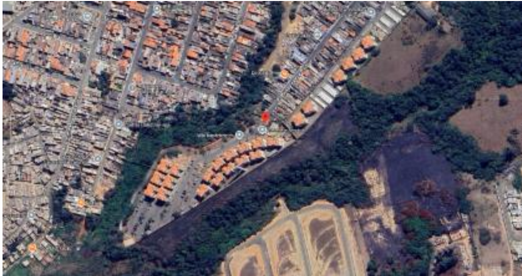
Croqui de localização do avaliando