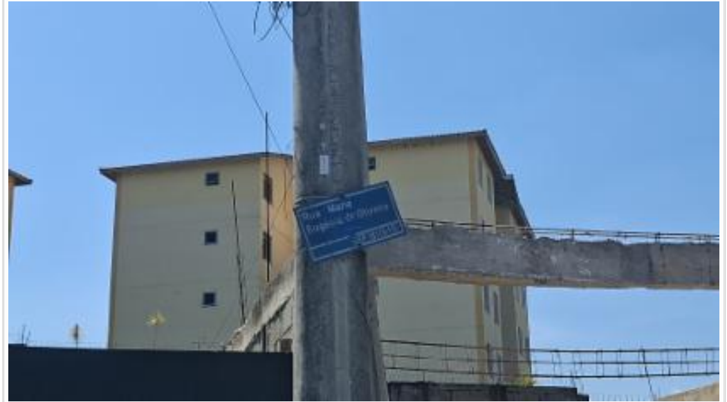
placa da rua