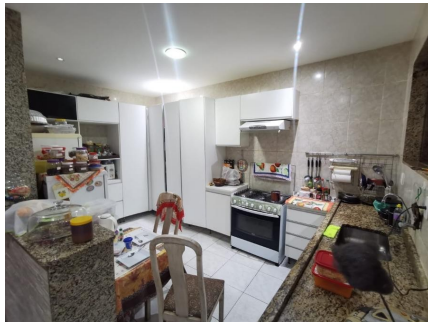
Representação Cozinha Descrição Data Foto 06/07/2021