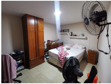
Representação Dormitório Descrição Data Foto 06/07/2021