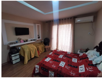
Representação Dormitório Descrição Data Foto 06/07/2021