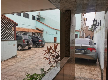
Representação Pátio Descrição Acesso - pátio Data Foto 06/07/2021