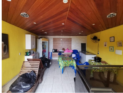
Representação Sala de Jogos Descrição Terraço Data Foto 06/07/2021