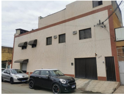
Representação Fachada Principal Descrição Data Foto 06/07/2021