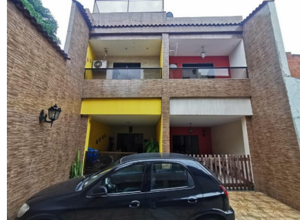
Representação Fachada Principal Descrição Casa 10 e 11 Data Foto 06/07/2021