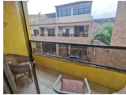
Representação Varanda / Sacada Descrição Data Foto 06/07/2021