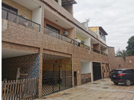
Representação Fachada Principal Descrição Casas Data Foto 06/07/2021