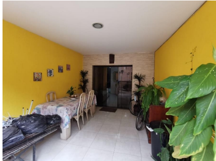
Representação Varandão Descrição Data Foto 06/07/2021