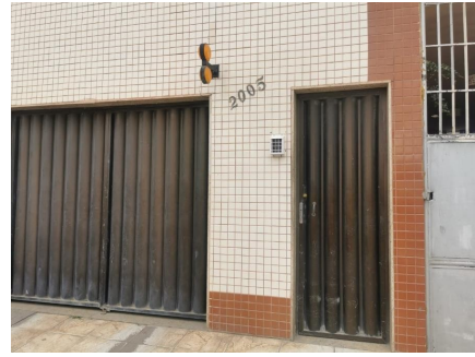
Representação Identificação Numérica Descrição Data Foto 06/07/2021