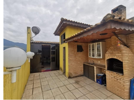
Representação Churrasqueira Descrição Data Foto 06/07/2021