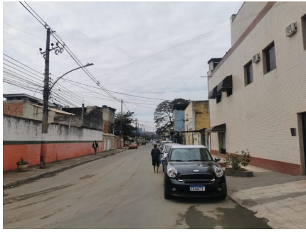
Representação Vista da Rua Descrição Data Foto 06/07/2021