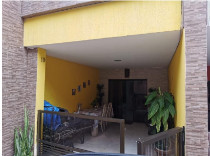
Representação Identificação Numérica Descrição Casa 10 Data Foto 06/07/2021