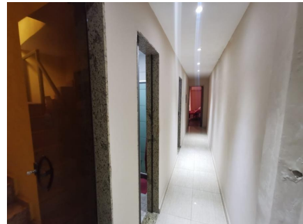
Representação Corredor Descrição Data Foto 06/07/2021