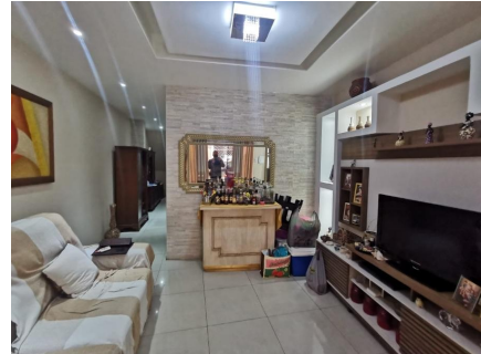
Representação Sala de Estar / Visitas Descrição Data Foto 06/07/2021