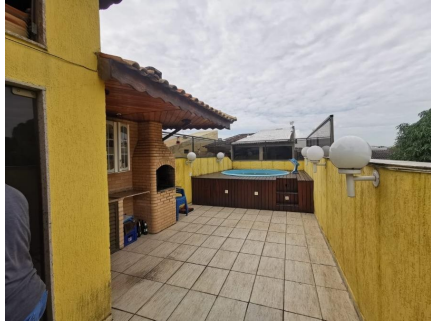
Representação Terraço Descrição Data Foto 06/07/2021