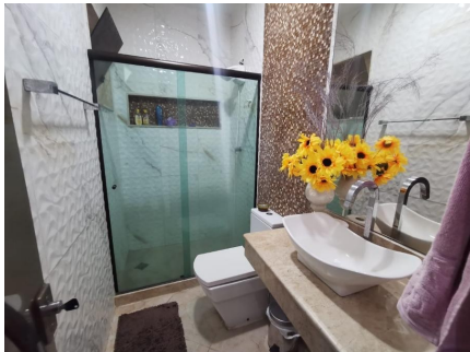
Representação Banheiro social Descrição Data Foto 06/07/2021