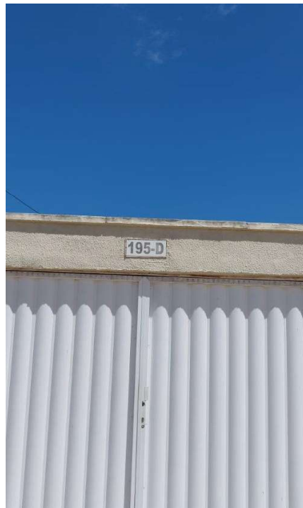
Representação Identificação Numérica Descrição Identificação numérica Data Foto 30/10/2023