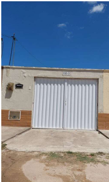
Representação Fachada Principal Descrição Outra vista da frente Data Foto 30/10/2023