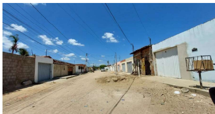
Representação Vista da Rua Descrição Vista da rua do avaliando Data Foto 30/10/2023