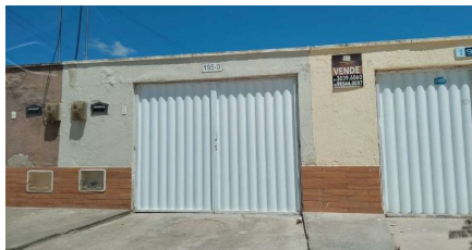
Representação Fachada Principal Descrição Frente do avaliando Data Foto 30/10/2023