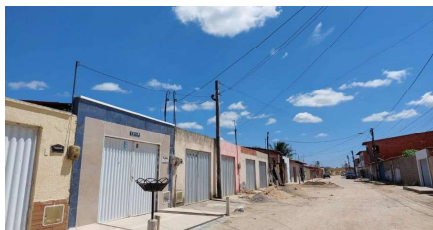
Representação Vista da Rua Descrição Vista do rua do avaliando Data Foto 30/10/2023