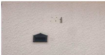
Representação Identificação Numérica Descrição Identificação numérica encontrada no local Data Foto 31/05/2023