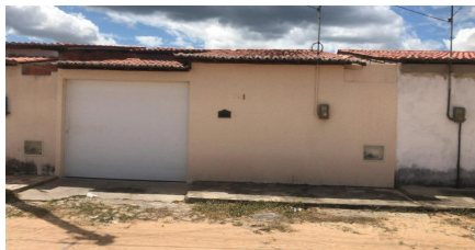
Representação Fachada Principal Descrição Frente do avaliando Data Foto 31/05/2023