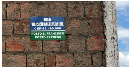
Representação Vista da Rua Descrição Placa de identificação da rua Data Foto 31/05/2023