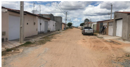
Representação Vista da Rua Descrição Vista da rua Data Foto 31/05/2023