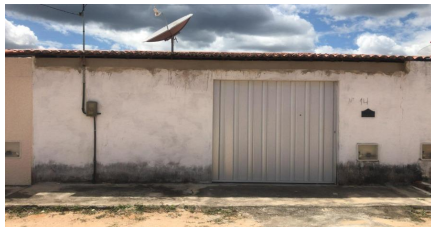
Representação Fachada Principal Descrição Vizinho lado direito Data Foto 31/05/2023