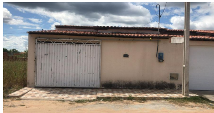
Representação Fachada Principal Descrição Vizinho lado esquerdo Data Foto 31/05/2023