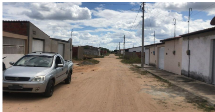
Representação Vista da Rua Descrição Outra vista da rua Data Foto 31/05/2023