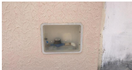
Representação Fachada Principal Descrição Medidor de água Data Foto 31/05/2023