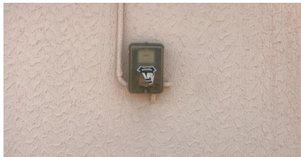
Representação Fachada Principal Descrição Medidor de luz Data Foto 31/05/2023