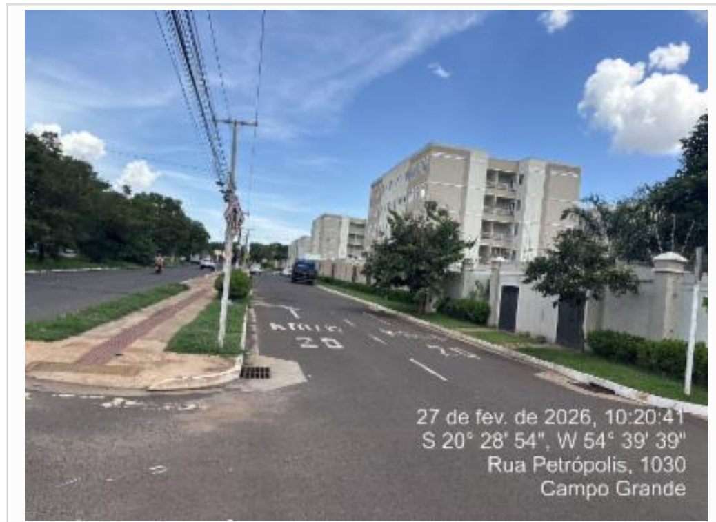
VISTA DA AVENIDA