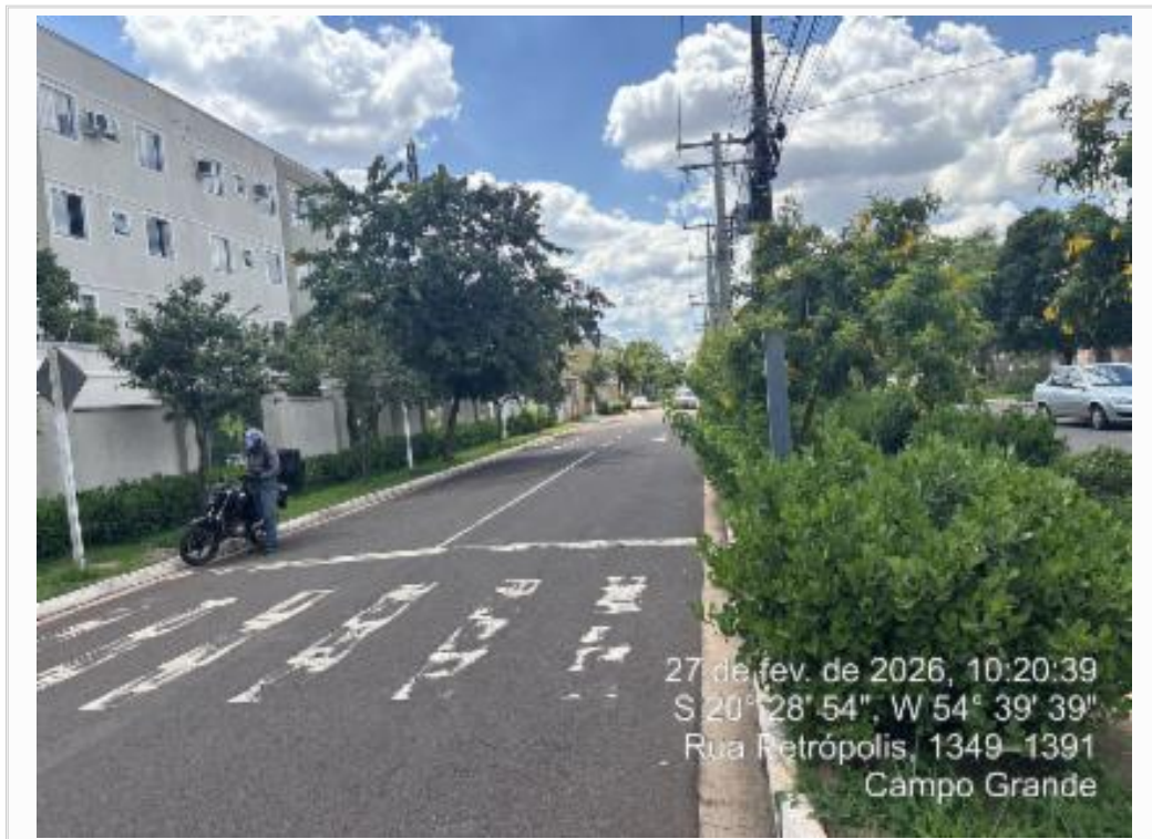
VISTA DA AVENIDA